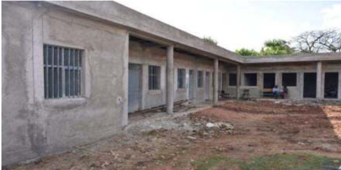
ምስል 5:- በደብረማርቆስ ከተማ አስተዳደር በህብረተሰብ ተሳትፎ ግንባታው በመጠናቀቅ ላይ የሚገኘው የቀበሌ 10 ቢሮ