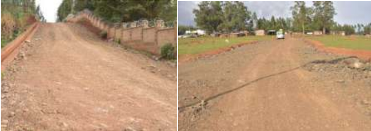
ምስል 9:- በደብረማርቆስ ከተማ አስተዳደር በህብረተሰብ ተሳትፎ ተጠናቆ ለአገልግሎት ክፍት ከሆኑ መንገዶች መካከል በከፊል

የደብረማርቆስ ከተማ የህብረተሰብ ተሳትፎ እንቅስቃሴ ከገቢ፣ ጾታ፣ ዕድሜና አካላዊ/አይምሯዊ ሁኔታ ችሎታን እንዲሁም የሃይማኖት ተቋማትንም ጭምር ያሳተፈና ዋጋ የሰጠ ነው።