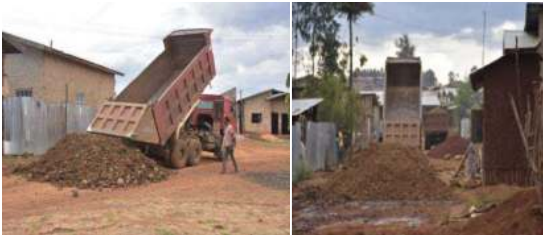
ምስል 3:- በደብረማርቆስ ከተማ አስተዳደር በህብረተሰብ ተሳትፎ ለተሰራው መንገድ የገረጋንቲ አቅርቦት በከፊል