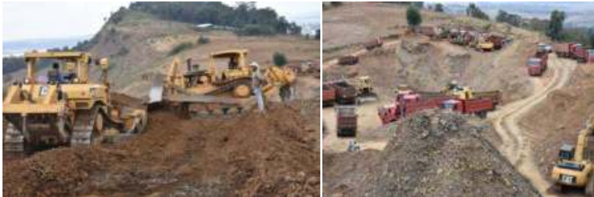
ምስል 1:- የደብረማርቆስ ከተማ ባለሀብቶች ለመንገድ ስራ በራሳቸው ወጪ ተከራይተው ያቀረቧቸው ማሽኖች በከፊል