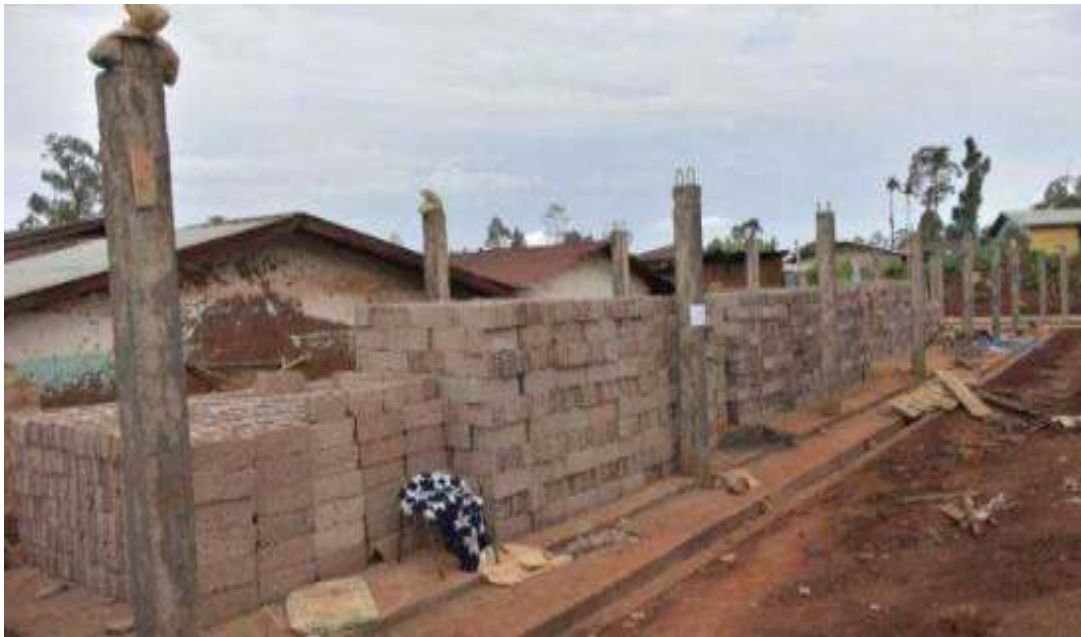
ምስል 8:- በደብረማርቆስ ከተማ አስተዳደር በህብረተሰብ ተሳትፎ እየተገነባ የሚገኘው የቀበሌ 8 ቢሮ