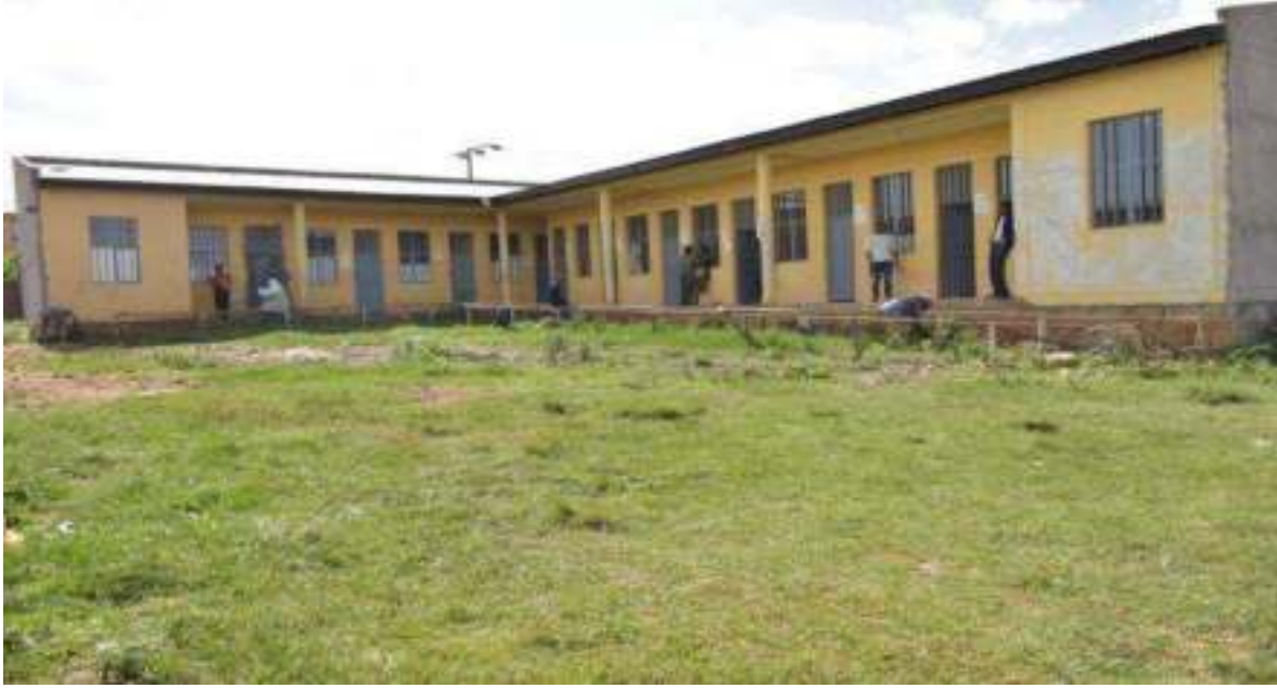
ምስል 7:- በደብረማርቆስ ከተማ አስተዳደር በህብረተሰብ ተሳትፎ ግንባታው ተጠናቆ አገልግሎት በመስጠት ላይ የሚገኘው የቀበሌ 8 ቢሮ