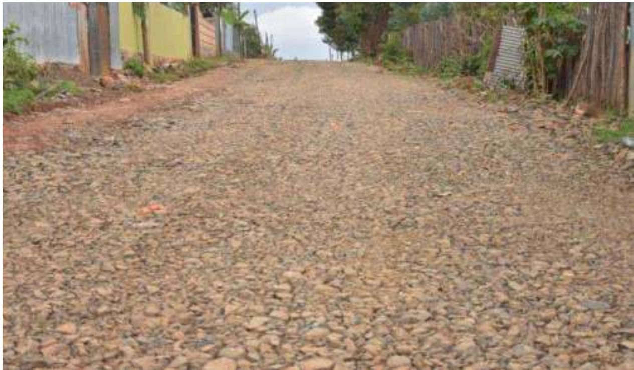
ምስል 4:- በደብረማርቆስ ከተማ አስተዳደር በህብረተሰብ ተሳትፎ የተሰራ መንገድ በክፍል