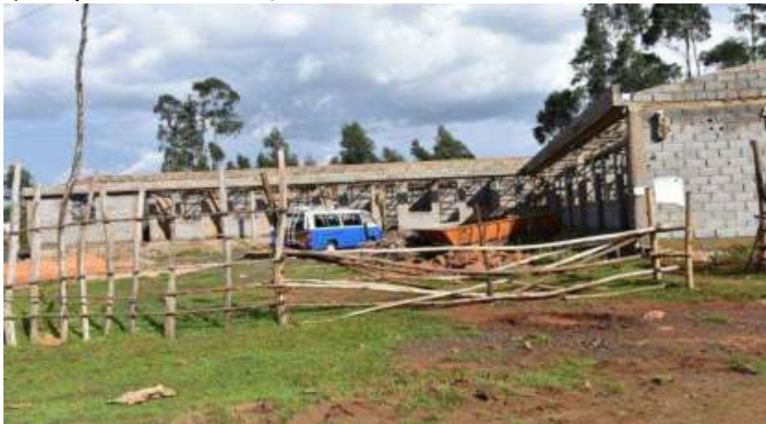
ምስል 6:- በደብረማርቆስ ከተማ አስተዳደር በህብረተሰብ ተሳትፎ እየተገነባ የሚገኘው የቀበሌ 11 ቢሮ