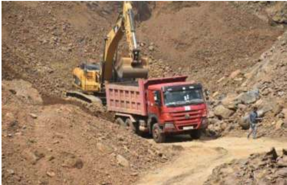
ምስል 2:- በከተማ አስተዳደሩ የተመቻቸ የገረጋንቲ ማምረቻ ቦታ